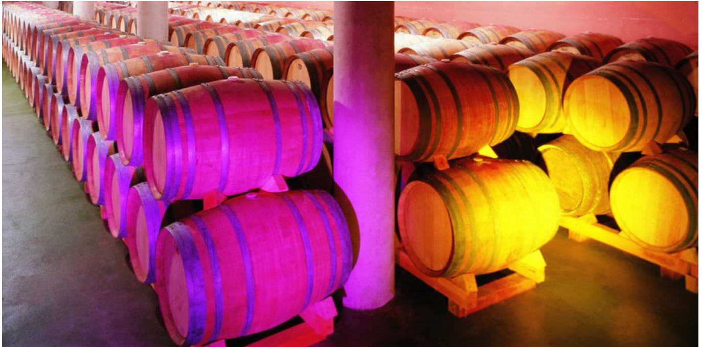
Weinreise Rioja exklusiv