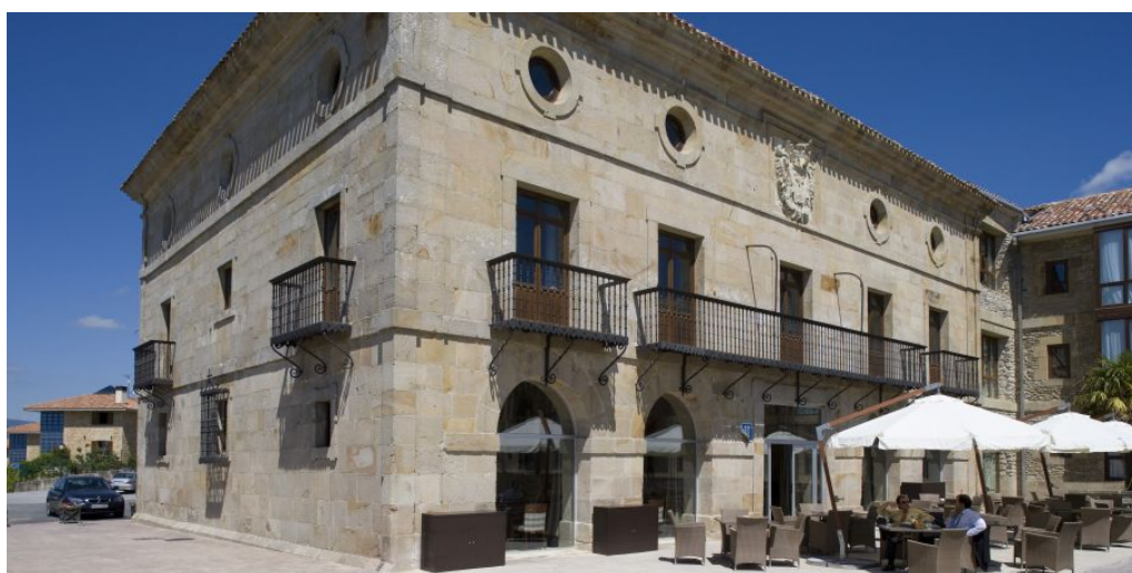
Parador Argomaniz

Sie nehmen am Flughafen Bilbao Ihren Mietwagen entgegen und fahren hinein ins Baskenland. Der Parador de Argómaniz, wo Sie übernachten werden, ist ein eleganter Renaissancepalast, der sich neben einer kleinen, nur wenige Kilometer von Vitoria entfernten Ortschaft an der Ebene Álavas befindet. Er steht am Fuße des Gebirgszuges „Sierra Gorbea“; auch zum Stausee Ullibarri Gamboa ist es nicht weit. Hier oder auch in der nahe gelegenen Hauptstadt des Baskenlandes Vitoria Gasteiz können Sie schon die Weine der Rioja Alavesa mit passenden Pintxos probieren.