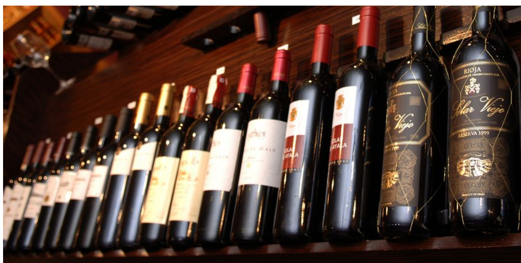
Rioja Alavesa

Fahrtstrecke: ca. 80 km (inkl. Rundfahrten in der Umgebung)