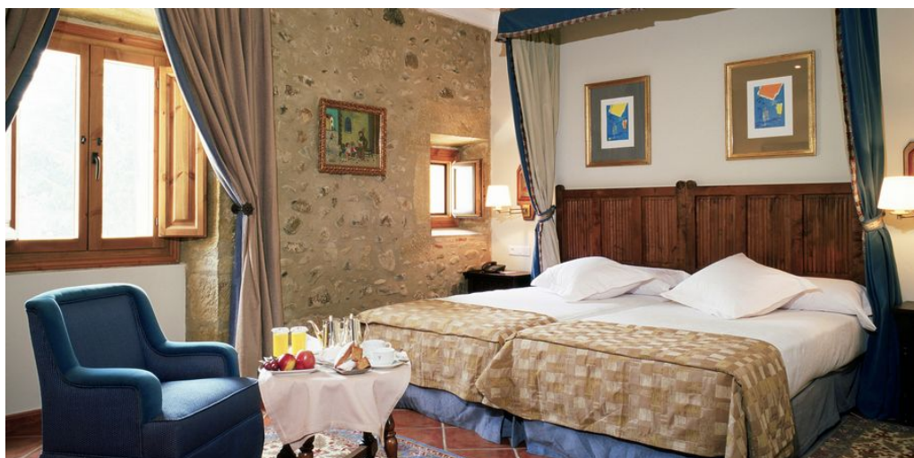
Parador Santo Domingo de la Calzada

Fahrtstrecke: ca. 150 km (inkl. Rundfahrten in der Umgebung)