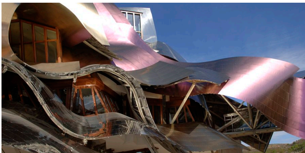
Bodega Marqués de Riscal

Fahrtstrecke: ca. 100 km (inkl. Rundfahrten in der Umgebung)