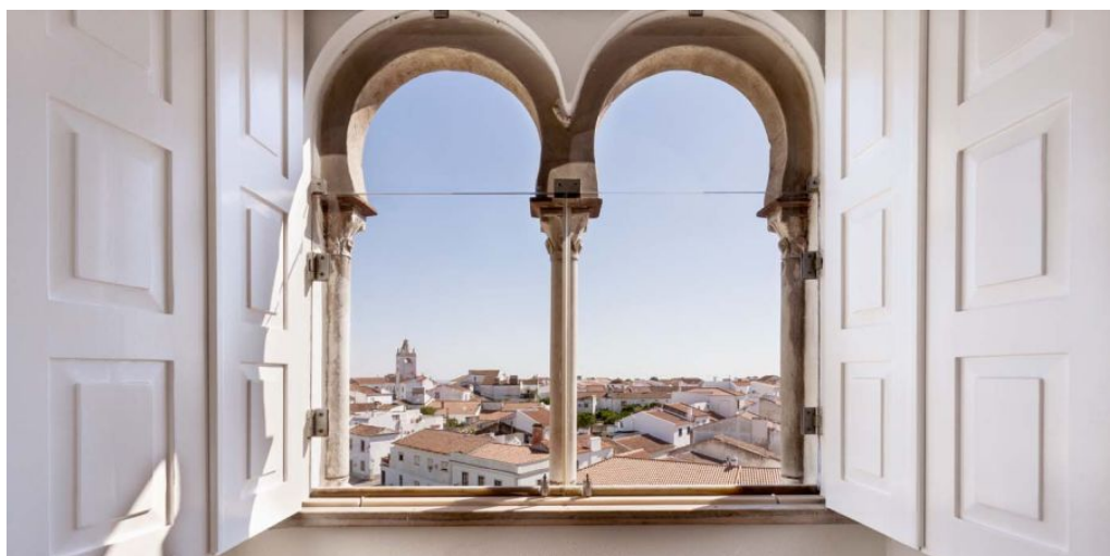
Pousada Alvito

Sie verlassen die Algarve Richtung Norden und fahren mit Ihrem Mietwagen zur Pousada de Alvito. Sie wurde 1993 eröffnet und entstand durch die Renovierung einer Burg aus dem 15. Jahrhundert. Das Gebäude wurde 1910 zum Nationaldenkmal erklärt und ist ein schönes Beispiel für die portugiesische Architektur. Es verbindet in harmonischer Weise eine Palastresidenz und Festung mit islamischen, gotischen und manuelinischen Einflüssen. Die Gärten der Burg von Alvito, die 1993 von dem berühmten Architekten Gonçalo Ribeiro Telles geplant wurden, sind wie die landwirtschaftlich genutzten Flächen mittelalterlicher Burgen konzipiert und werden durch einen altertümlichen Ziehbrunnen bewässert.