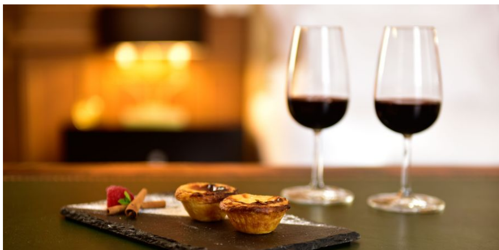
Genuss in Südportugal

Privattransfer vom Hotel in Lissabon zum Flughafen