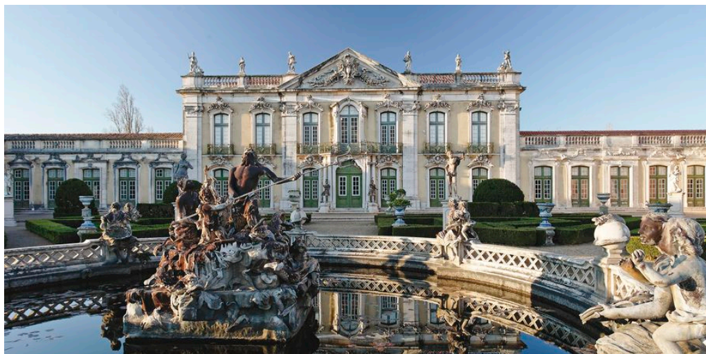
Palacio de Queluz

Beginn Ihrer Rundreise mit der Entgegennahme des Mietwagens am Flughafen Lissabon und Fahrt nach Queluz. Die Pousada de Queluz ist in einem Gebäude untergebracht, das den Namen Torre do Relógio (Glockenturm) trägt. Es war Teil des Nationalpalastes Palácio de Queluz, der auch als das "portugiesische Versailles" bezeichnet wird und ab 1794 die ständige Residenz der Königlichen Familie war. Mit ihrer einzigartigen und prunkvollen Ausstattung ist die Pousada de Queluz, D. Maria, reich an Schätzen, die es zu entdecken gilt. Die in warmen Farben gehaltenen Zimmer sind individuell dekoriert und mit eleganten Holzmöbeln eingerichtet. Sintra, mit seinen zahlreichen hübschen Palästen einer der schönsten Orte der Region, ist nur einen Katzensprung entfernt.