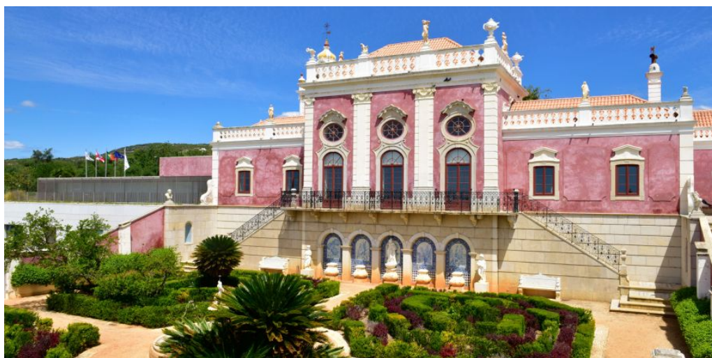
Pousada Estoi

Heute erwartet Sie Ihr Portugal Roadtrip mit einer wunderschönen Fahrt in den Süden des Landes mitten durch den Alentejo bis an die Atlantikküste an der Algarve. Hier empfehlen wir Ihnen einen Zwischenstopp am Strand Praia de Albufeira, bevor Sie das kleine Dorf Estoi erreichen, welches zwischen São Brás de Alportel und Faro liegt. Zwischen den typischen Häusern der Algarve mit ihren blumengesäumten Straßen findet man einen Rokokopalast aus dem 18. Jahrhundert, der wie aus einem Märchen mit Königen, Magiern und Feen erscheint, umgeben von verzauberten Gärten voller Orangenbäume und Palmen. Faro ist nur 10 km entfernt. Genießen Sie die sonnenverwöhnte Küste der Algarve mit ihren traumhaften Stränden und entdecken Sie auch das schöne Hinterland auf Ihrer Portugal Rundreise!