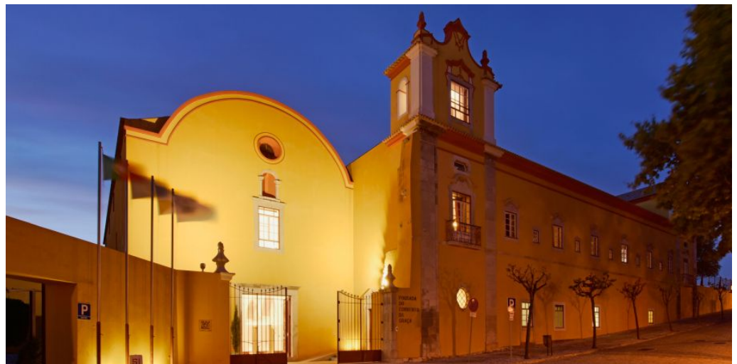
Pousada Tavira

Sie führen Ihre Reise nun mit einem Besuch der Stadt Tavira fort, welche neben Lissabon, Porto, Faro, Lagos und Coimbra zu den schönsten Städten des Landes zählt. Die Pousada de Tavira, Convento da Graça, befindet sich im Kloster Santo Agostinho, das von König D. Sebastião im 16. Jahrhundert gegründet wurde. Dieses Hotel in Tavira verbindet in vollendeter Harmonie einen klassischen Stil mit moderner Einrichtung und schafft dadurch ein warmes, einladendes Ambiente. Die Pousada de Tavira hält ihren Gästen 36 Zimmer bereit, die alle einen Ausblick auf den Innenhof oder den Garten mit seinem Schwimmbad haben. Während der Hotelumbauten wurden archäologische Hinterlassenschaften islamischen Ursprungs aus dem 13. Jahrhundert entdeckt.