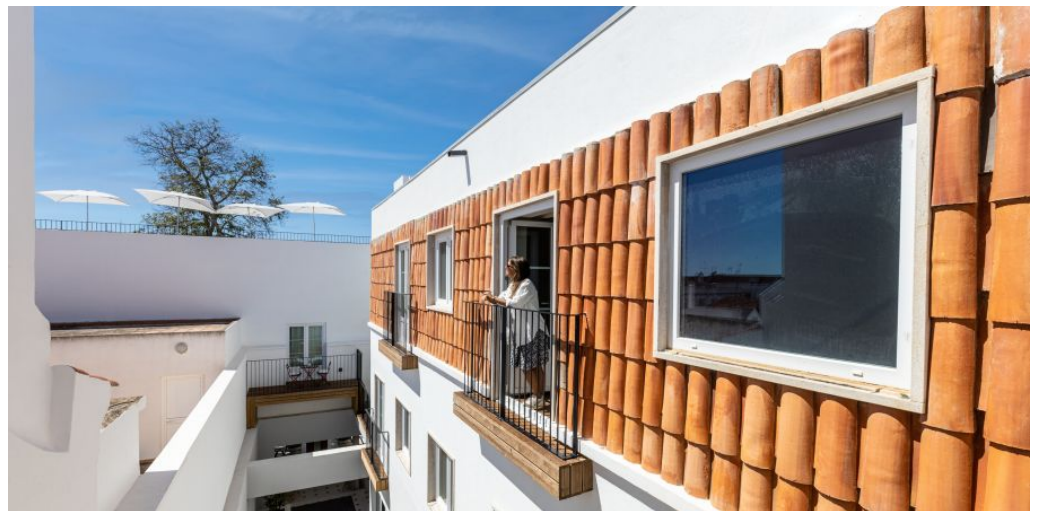
Pousada Vila Real de Santo Antonio

Die Pousada de Vila Real de Santo António liegt an der Praça Marquês de Pombal, im historischen Zentrum der Stadt. Sie ist in einem historischen Zollhaus untergebracht und bietet eine entspannte Atmosphäre mit drei Swimmingpools, schönen Gästezimmern und einer einladenden Dachterrasse. In der Nähe finden Sie lange Sandstrände und das Naturschutzgebiet Castro Marim. Nur wenige Gehminuten sind es bis zum Fluss Guadiana, der natürlichen Grenze zu Spanien.