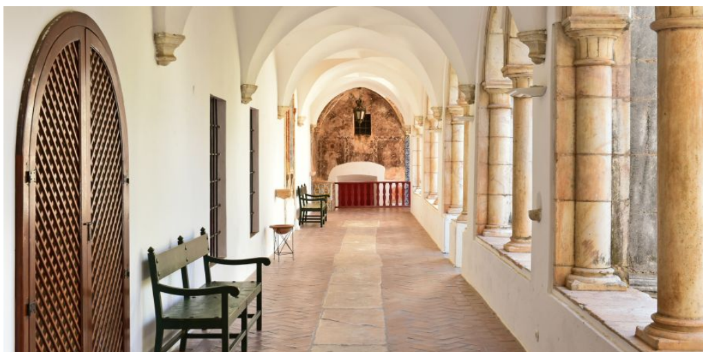
Pousada Vila Vicosa