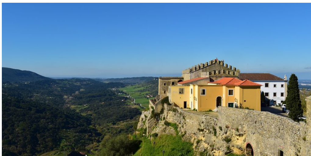
Pousada Palmela

Heute führt Sie Ihre Rundreise Portugal nach Palmela. Die Pousada de Palmela, die innerhalb der mächtigen Burg von Palmela errichtet und 1979 eröffnet wurde, zählt zu ihren besonderen Schmuckstücken die schönen Kreuzgänge eines ehemaligen Klosters. Dieses Hotel in Palmela lädt mit seiner hervorragenden Lage auf der Spitze eines beeindruckenden Hügels, nur wenige Kilometer von Lissabon entfernt, zur Erholung und Entspannung ein. Die Pousada bietet ein reizvolles Panorama über die Serra da Arrábida und den Atlantischen Ozean und auch über die weiten Ebenen und das Weinanbaugebiet dieser Region.