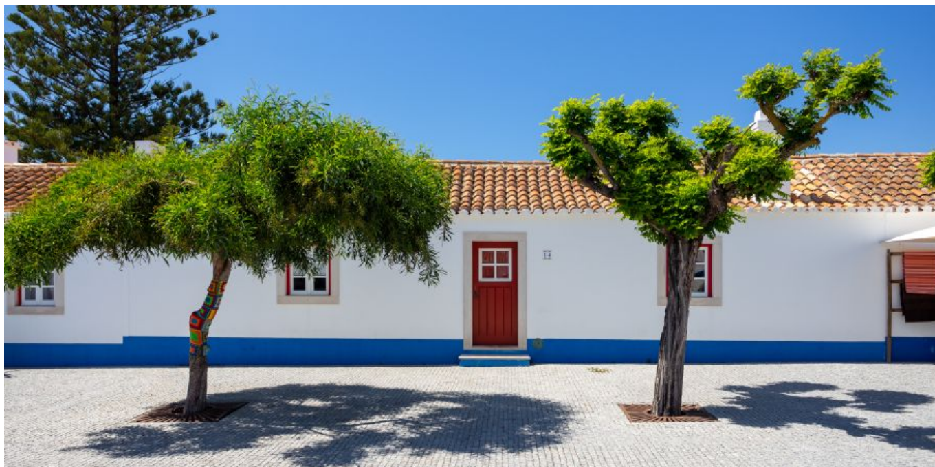
Rundreise durch die historischen Pousadas Südportugals