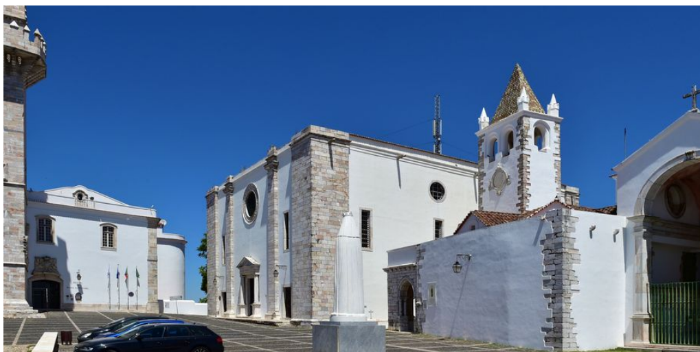
Pousada Estremoz

Ganz in der Nähe liegt die nächste Station Ihrer Reise: Die Pousada de Estremoz befindet sich inmitten der Burg von Estremoz. Ihre antiken Möbel, Wandteppiche, schmiedeeisernen Kunstgegenstände und manch altes Porzellan stellen regelrechte Museumsstücke dar. Die Pousada trägt den Namen der Königin Santa Isabel. Ihr zu Ehren ließ König D. Dinis diesen Palast, der Schauplatz der Geschichte von Kämpfen, Liebe und Verrat war, einst im Schutzwall der Stadt erbauen. Von seinen bezaubernden Gärten und dem Schwimmbad aus bietet dieses Hotel seinen Gästen einen unvergesslichen Ausblick auf die weiten Ebenen des Alentejos. Die Zimmer der Pousada erweisen der ehemaligen königlichen Burg alle Ehren. Die schönen Himmelbetten laden zu einer erholsamen Nacht während Ihrer Portugal Rundreise ein.