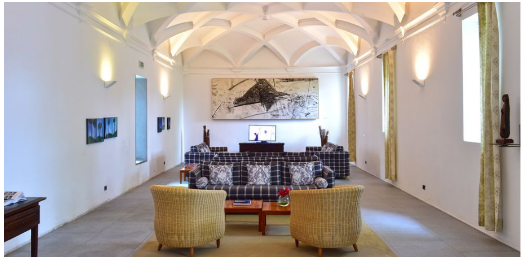
Pousada Arraiolos

Auf der vorletzten Etappe Ihrer Portugal Rundreise erwartet Sie ein Aufenthalt in der Pousada de Arraiolos, Nossa Senhora da Assunção. Sie wurde in einem Kloster aus dem 16. Jahrhundert eingerichtet und stellt ein Musterbeispiel für die kunstvolle Renovierung historischer Gebäude dar, die die traditionelle und die moderne Architektur auf harmonische Weise miteinander verbindet. Im Mittelalter diente das Kloster der Evangelisierung der örtlichen Bevölkerung. Erkunden Sie das Städtchen Arraiolos, dessen kulturelles Erbe durch seine einzigartigen, in Handarbeit gefertigten Teppiche weltweit anerkannt ist!