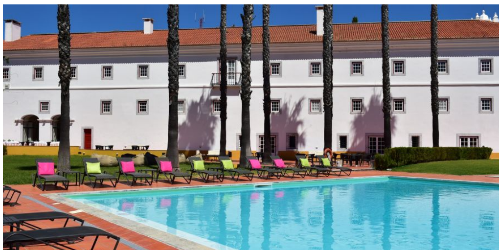
Pousada Beja

Heute führt Ihre Reise Sie in die Alentejo-Ebene, wo Sie in Beja ein ehemaliges Franziskanerkloster aus dem 13. Jahrhundert mitten in der Stadt erwartet. Nur einen Katzensprung entfernt liegen die Burg sowie das Museu Rainha D. Leonor. Die Pousada ist ein majestätischer Bau, der die religiöse und gotische Bauweise Portugals perfekt repräsentiert. Die Zimmer befinden sich alle in den ehemaligen Mönchszellen. Entspannen Sie im Spa oder flanieren Sie durch die wunderschönen Gartenanlagen der Pousada.